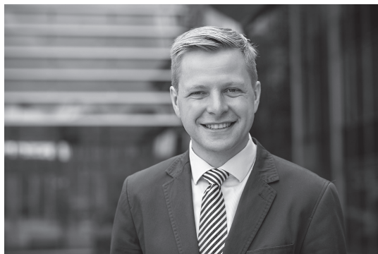
REMIGIJUS ŠIMAŠIUS Vilniaus meras Mayor of Vilnius City