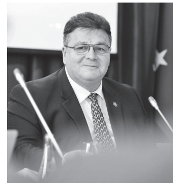
LINAS LINKEVIČIUS Lietuvos Respublikos užsienio reikalų ministras Minister of Foreign Affairs of the Republic of Lithuania

LIETUVOS ŽYDŲ BENDRUOMENĖ LIETUVOS NACIONALINĖ FILHARMONIJA KAUNO VALSTYBINĖ FILHARMONIJA LIETUVOS MUZIKOS IR TEATRO AKADEMIJA LIETUVOS DAILĖS MUZIEJUS TAKOMOSIOS DAILĖS IR DIZAINO MUZIEJUS VILNIAUS PAVEIKSLŲ GALERIJA VYTAUTO KASIULIO DAILĖS MUZIEJUS LIETUVOS MOKSLŲ AKADEMIJA STASIO VAINIŪNO NAMAI VILNIAUS GEDIMINO TECHNIKOS UNIVERSITETAS MYKOLO ROMERIO UNIVERSITETAS GENEROLO JONO ŽEMAIČIO LIETUVOS KARO AKADEMIJA BENDRIJA „ATGAIVA“ SENJORŲ SOCIALINĖS GLOBOS NAMAI VILNIAUS KAROLINIŠKIŲ MUZIKOS MOKYKLA VILNIAUS ŠOLOMO ALEICHEMO ORT GIMNAZIJA ŽURNALAS „SANTARA“