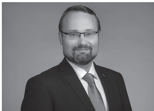
MINDAUGAS KVIETKAUSKAS Lietuvos Respublikos kultūros ministras Minister of Culture of the Republic of Lithuania

Jau 22-ąją pavasarį pasitinkame su festivaliu „Sugrįžimai“. Džiaugiuosi, kad šis festivalis nuo pat savo pradžios suteikia progą sugrįžti talentingiems, galbūt mūsų šalyje dar nepakankamai žinomiems jauniems žmonėms, kurie atsiveža vertingą muzikos meno patirtį. Tai puiki proga naujiems atradimams, naujiems susitikimams, naujoms pradžioms.